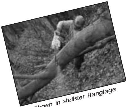
Sägen in steilster Hanglage