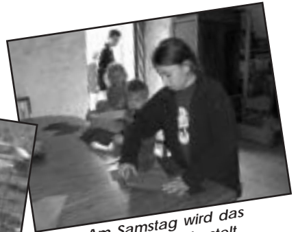
Am Samstag wird das Osternest gebastelt