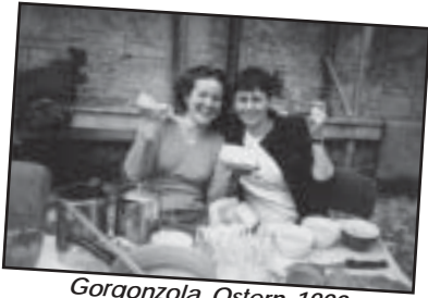
Gorgonzola Ostern 1999

ren nach wie vor Knöpfli (mit oder ohne Gorgonzola!!!), lange Jassabende mit Wein und Schoggi, der Frühlingsputz, um das Lagerhaus auf Vordermann zu bringen und der traditionelle Oster-sonntagsspaziergang zum Bisbino (na ja, die-