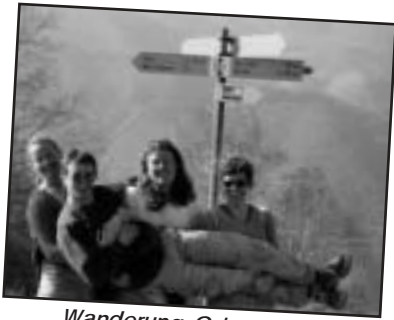
Wanderung Ostern 2002

Also, was kann ich nach 15 Jahren Loasa-Ostern noch Neues zu berichten? Ist es immer noch das gleiche? Was (ausser unserem Alter!!!) hat sich verändert?