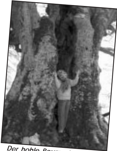
Der hohle Baum eignet sich gut zum Klettern