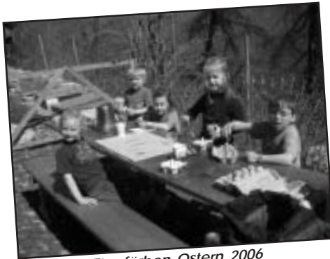
Eier färben Ostern 2006

Ganz offensichtlich hat sich die Anreisezeit verändert. Vor 15 Jahren noch die Schulbank drückend, war ein freigemachter Grün-Donnerstag-Nachmittag noch möglich, um noch den letzten Bus nach Bruzella zu erreichen. Doch irgendeinmal musste man ja dann auch am Nachmittag noch arbeiten, wodurch sich die Abreise auf den Abend verschob. Naja, ein tolles Antipasti-Znacht mit Vino im Zug, ein Taxi nach Bruzella und die Vollmondwanderung zur Alpe wurden dann zum Renner für ein paar Jahre.