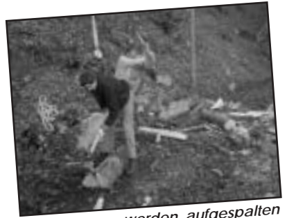
Die Stämme werden aufgespalten