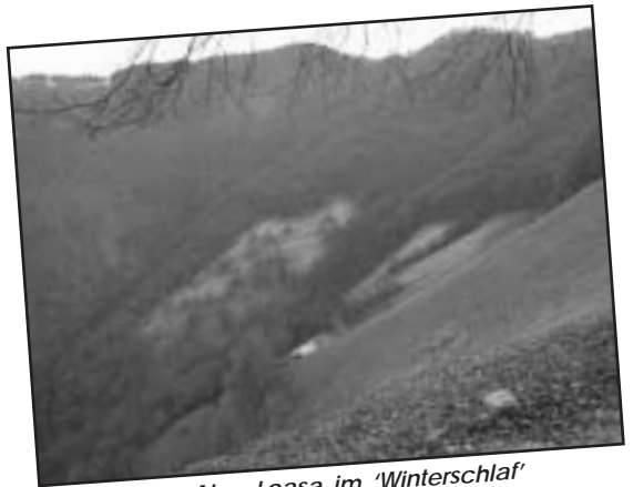
Die Alpe Loasa im 'Winterschlaf'