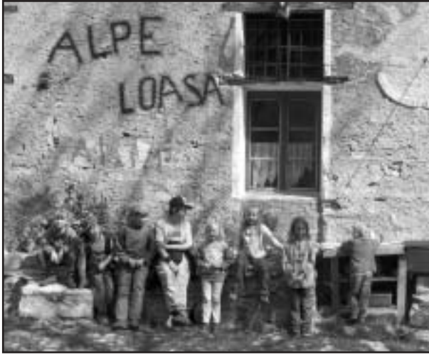
Nach 1.5h Aufstieg noch (wieder) quitschfidel