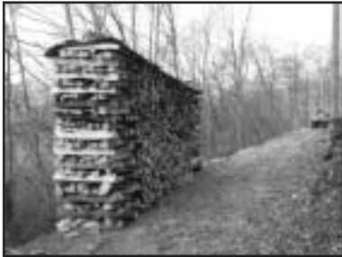
Als Resultat nur eine Beige, aber was für Eine!