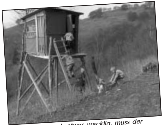
Wenn auch etwas wacklig, muss der Jägerstand schon erkundet werden