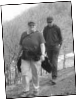
Wanderung Ostern 2006

Loasa-Ostern möchte ich gar nicht mehr missen. Zu mind. 90% bescherte mir das Südtessin wunderschöne Frühlingstage (na ja, geschneit hat es auch schon!) und jedes Jahr lernt man wieder neue Leute kennen! Es lohnt sich einfach! Ich freu mich schon auf nächstes Jahr... wer ist dann auch (wieder) dabei?