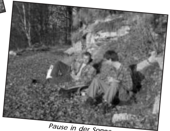
Pause in der Sonne