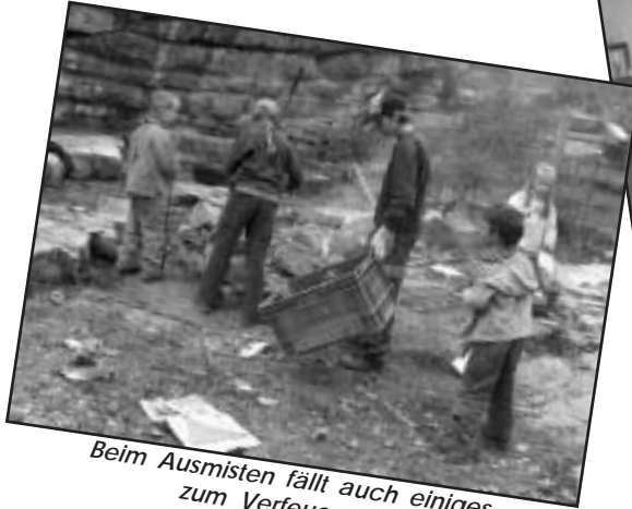
Beim Ausmisten fällt auch einiges zum Verfeuern an