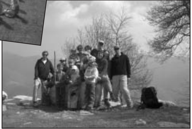
Die ganze Ostertruppe auf der Bugone, auch ohne Glace ganz munter (es fehlen nur Pius und Nicole!)