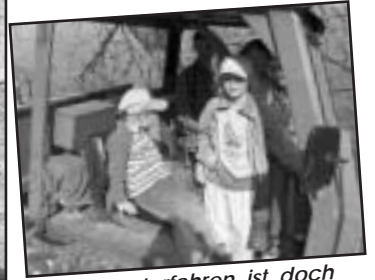
Tranporterfahren ist doch immer wieder beliebt