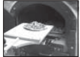
Einweihung des neuen Pizzaofens an Ostern 2000

Ganz offensichtlich hat sich die Anreisezeit verändert