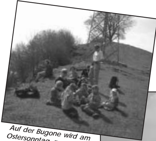
Auf der Bugone wird am Ostersonntag gepicknickt